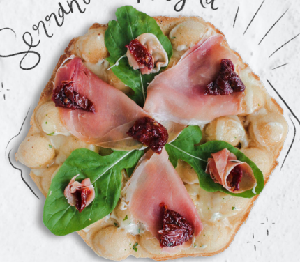
Serrano + Arúgula